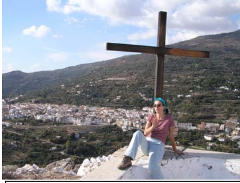
Foto nº 24. Lanjarón desde la Ermita de Santa Cruz.

“En Lanjarón vemos árboles de aguacates. Y nos impresiona como convive su bosque de castaños con los árboles tropicales. Eso nos da una idea del suave clima que tiene este pueblo de sierra (su municipio sube hasta los 3.150 m. de altura) y por eso no nos asombra que sea un lugar de