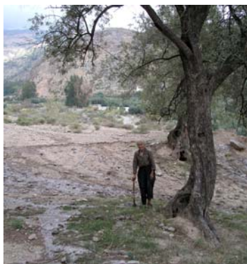
Foto nº 26. Paisaje. Al fondo se ve el pueblo de Carataunas.

antiguo molino de aceite. Por su grandeza nos imaginamos las moliendas que tuvo. Solo tenemos que cruzar el río Chico para adentrarnos ya en el centro del pueblo.