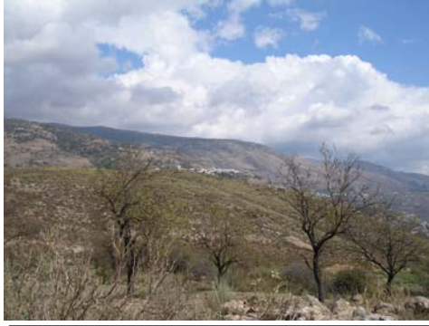
Foto nº 25. Paisaje. Al fondo el pueblo de Carataunas.

Dejando el Peñón de la Cruz, seguimos una pista subiendo entre olivos, sin tomar desvíos secundarios a la derecha, y llegamos a divisar otra hermosa panorámica: hacia el sur vemos el valle del Guadalfeo rodeado de empinadas montañas. A la izquierda dejamos otro desvío que sube hasta lo alto del Cerro, este ahora coronado por